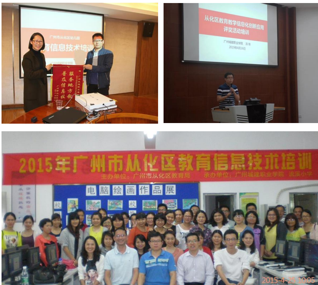
图 5 教育信息技术培训

为从化区教育局开展信息技术培训，培训乡村教师 200 余人，指导从化区中小学教师在省、市教学软件比赛中获奖，为乡村教育振兴贡献力量。为从化区总工会开展送课下基层活动，提升企事业单位员工信息技术应用水平，为地方院校开展讲座交流，扩大成果影响力。