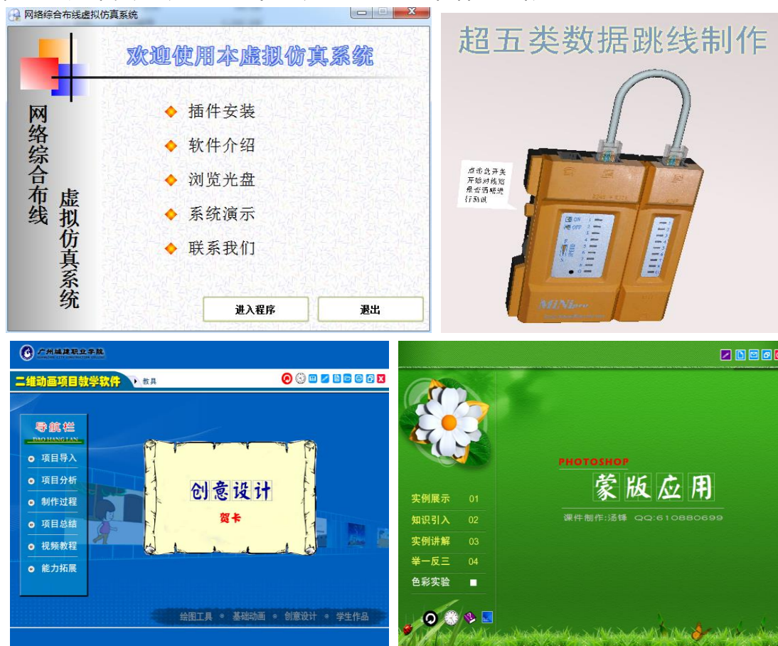
图 2 部分教学软件

程内容划分为超五类线制作、信息插座安装、墙内线管走线等 6 个实训项目，通过沉浸式教学，学生能直观了解实训全过程，解决了部分实训项目高成本、高消耗的难题，实践教学过程中难以让学生经历和体验的限制。