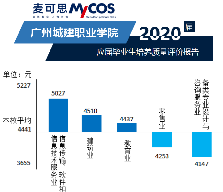
图4 麦可思就业质量调查